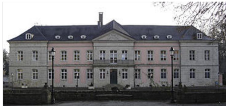
Ancienne maison de soins