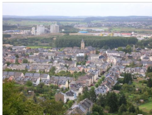
Vue sur la ville de Schiffflange

Depuis ici nous avons suivi le sentier des planètes décrit dans la brochure locale « Le saturne ». Après quelques Km nous changions le sentier pour retourner en ville. De puis les hauteurs nous avons eu la chance d'une vue lointaine de la région autour de Schiffflange.