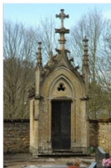
chapelle ardente sur le cimetière