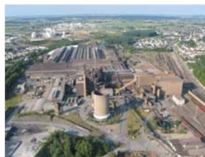
Vue sur les sites sidérurgie